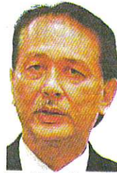
Tan Sri Dr Noor Hisham Abdullah

"Selangor's R0 is 0.97, Kuala Lumpur's is 0.92, Negri Sembilan's is 0.89 and Putrajaya's is 0.81. They are all lower than the national R0."