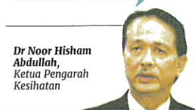
Dr Noor Hisham Abdullah, Ketua Pengarah Kesihatan

ProtectHealth melalui pengamal perubatan swasta sudah menjalankan tugas dengan cemerlang dalam membantu kerajaan mencapai sasaran vaksinasi di Selangor dan Lembah Klang. Berikutan itu, kita akan menutup PPV ini beransur-ansur