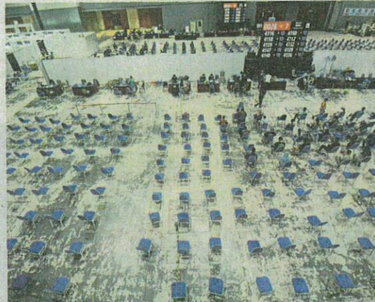
Excess capacity: A small crowd seen on the last day at the MIECC PPV in Seri Kembangan.

"Those seeking their second dose will be referred to another PPV if that particular PPV is not offering the same vaccine as that