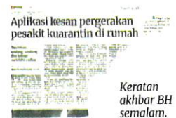
Keratan akhbar BH semalam.

lu rapi dan teliti bagi memastikan objektif utama penggunaan aplikasi itu tercapai.