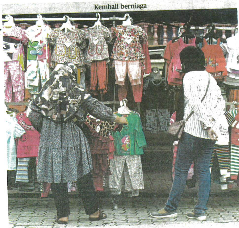
PENJUAL pakatan mula beroperasi di Pasar Pagi Taman Medan, Kuala Lumpur, semalam selepas kerajaan membenarkan kemudahan tambahan sektor ekonomi bagi individu yang sudah menerima vaksinasi lengkap diperluaskan antaranya aktiviti pasar pagi yang dibenarkan dibuka di negeri Fasa 1 Pelan Pemulihan Negara (PPN).

Kod mRNA asal akan musnah dengan sendirinya apabila ia sudah diterjemahkan