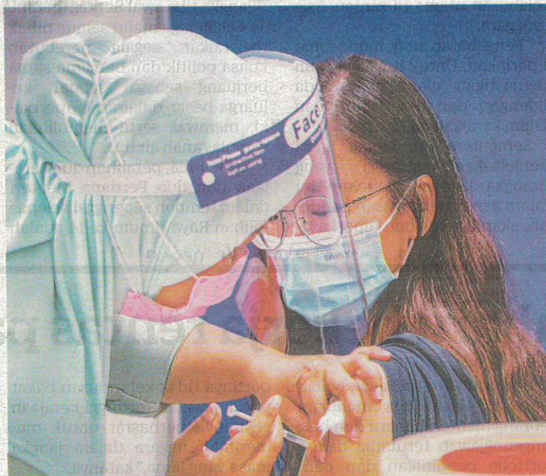
LEBIH 80 peratus daripada 19,807 jangkitan baharu yang dicatatkan semalam didapati tiada atau tidak lengkap vaksinasi. – GAMBAR HIASAN.

Beliau berkata, sebanyak 104 kes kategori lima dilaporkan dengan 98 kes tiada atau tidak lengkap vaksinasi, manakala sebanyak 68 kes kategori empat dengan