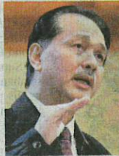
DR NOOR HISHAM

16,368 kes atau 82.6 peratus daripada jumlah kes dilaporkan itu fiada atau tidak lengkap vaksinasi.